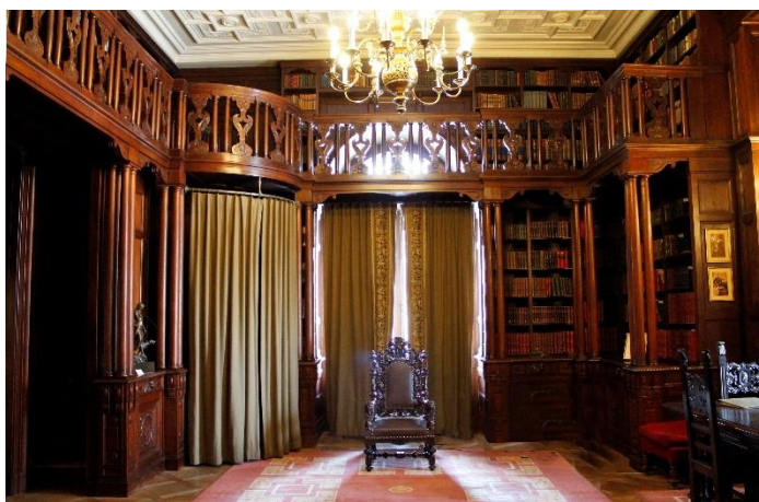
Fig. 5, Biblioteca Regelui Ferdinand din cadrul Muzeului Național Cotroceni Muzeul Național Cotroceni.