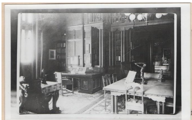
Fig. 3, Biblioteca regală de la Palatul Cotroceni, anii '30, Muzeul Național Cotroceni.