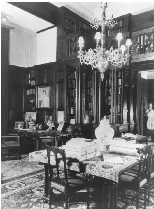
Fig. 2, Biblioteca regală de la Palatul Cotroceni, anii '20, Muzeul Național Cotroceni.