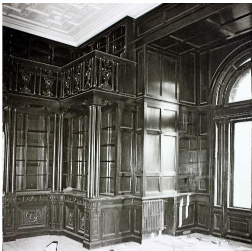
Fig. 4, Biblioteca Palatului Cotroceni după restaurare (1977-1980)