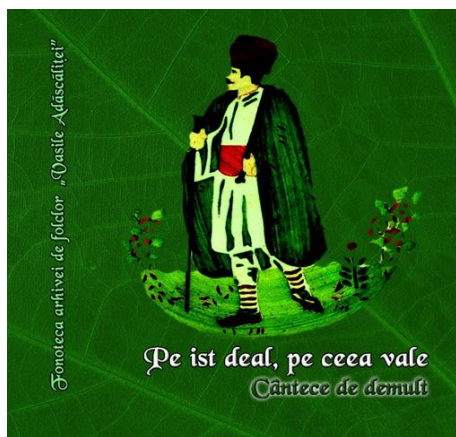
Fig. 3, Coperta vol. „Pe ist deal, pe ceea vale”, seria „Căntece de demult”