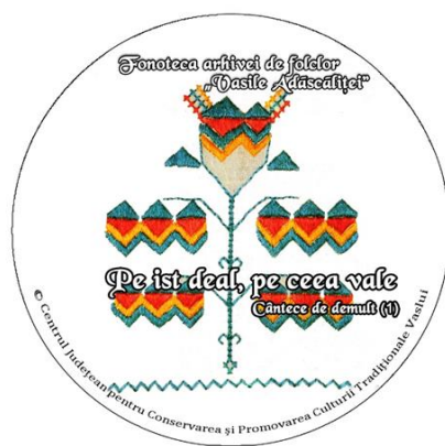
Fig. 4, Coperta CD Căntece de demult (1)