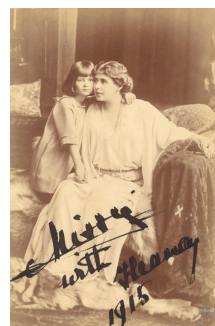
Fig. 7 - Regina Maria și Ileana, Muzeul Național Cotroceni.