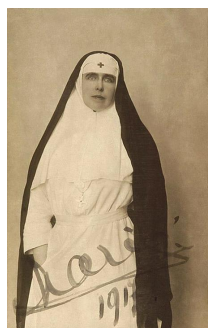
Fig. 8 – Regina Maria în uniformă de infirmieră, Muzeul Național Cotroceni.