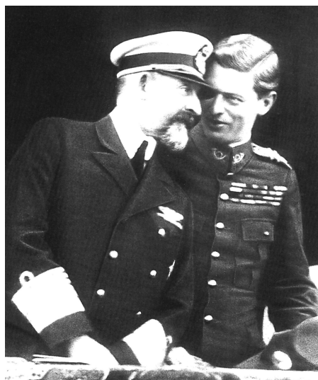
Fig. 3 – Regele Ferdinand și Principele Carol, Muzeul Național Cotroceni .