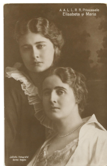
Fig. 4 – Principesa Elisabeta și Mignon, Muzeul Național Cotroceni.