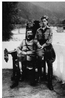
Fig. 5 – Regele Ferdinand și Nicolae, Muzeul Național Cotroceni.