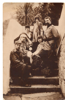
Fig. 9 – Familia regală la Bicăz, Muzeul Național Cotroceni.