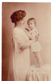
Fig. 6 – Regina Maria și Principele Mircea, Muzeul Național Cotroceni.