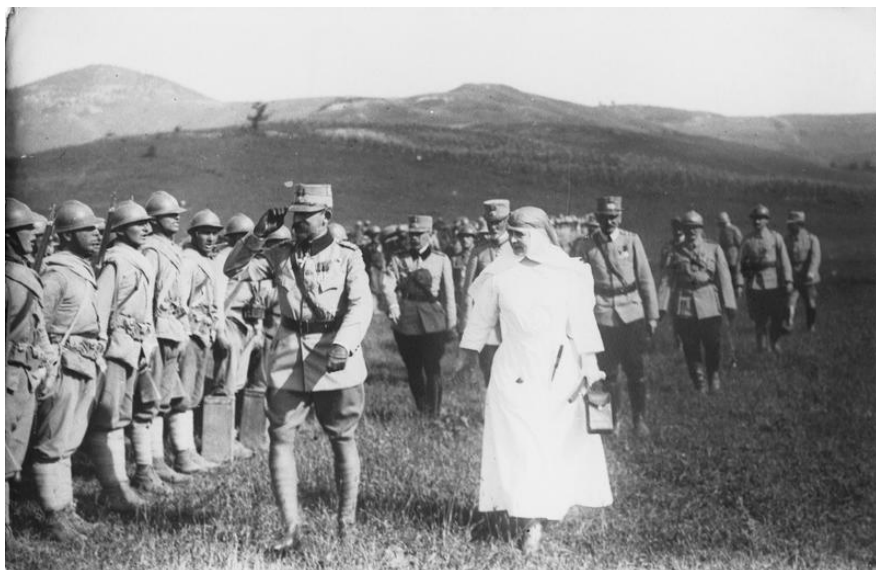
Fig. 1 – Regina Maria pe front, Muzeul Național Cotroceni .