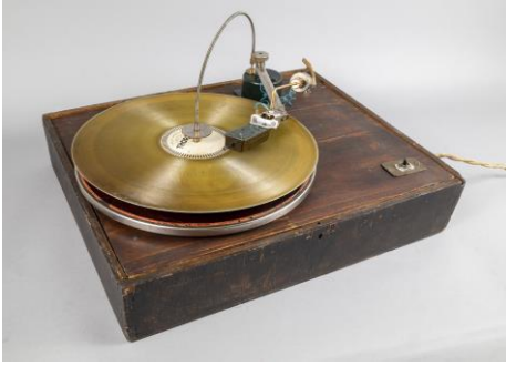
Fig. 4. Aparatul promovat de regimul comunist ca fiind cel pe care s-a înregistrat Proclamația regală expus în expoziția „România în al Doilea Război Mondial. 1941-1945”, iunie-noiembrie 2021, la Muzeul Național de Istorie a României