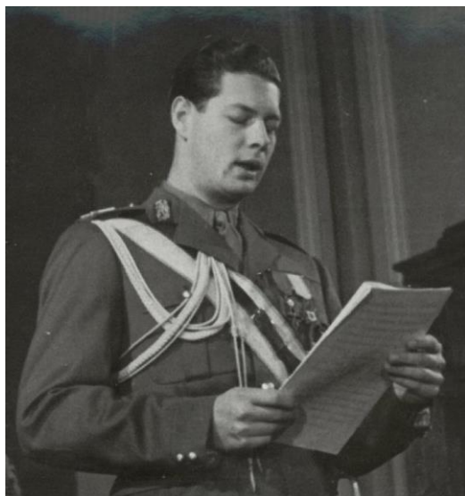
Fig. 1, Regele Mihai. ANR, fond CC al PCR - Albume - Gh. Gheorghiu Dej, dosar A6 (AF2733)