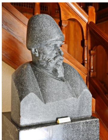
Fig. 3 - Bustul lui Ion I. .C Brătianu realizat de Ivan Meštrović pentru Așezamintele Brătianu