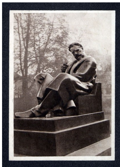
Fig. 2 - Monumentul lui Ion I. C. Brătianu, Biblioteca Națională României.