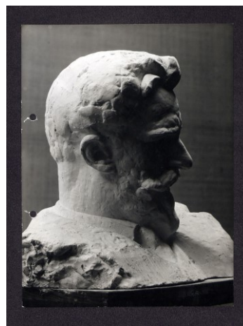
Fig. 4 - Bustul statuii lui Ion I. .C Brătianu, Biblioteca Muzeului Național Cotroceni