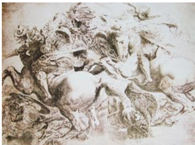
Fig. 2. Gabriel Popescu, Lupta de la Anghiari, 1913, fototeca Complexului Național Muzeal „Curtea Domnească” Târgoviște.