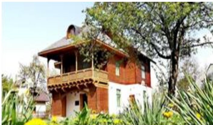
Fig. 3. Muzeul Gabriel Popescu, Vulcana Pandlele, jud. Dâmbovița, 2016, Fototeca Complexului Național Muzeal „Curtea Domnească” Târgoviște.