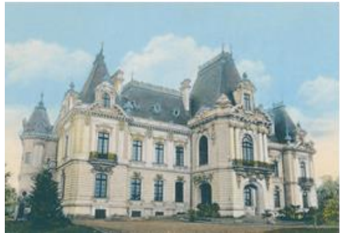
Fig. 3 – Palatul Dini Mihail, Carte poștală (începutul secolului al XX-lea).