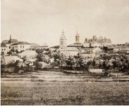
Fig. 1 – Palatul Dini Mihail, vizibil în spatele bisericilor Madona, aflată în prim plan, și Sfânta Treime, în plan secund, Carte poștală (1905), Colecția Mihai Murărețu.