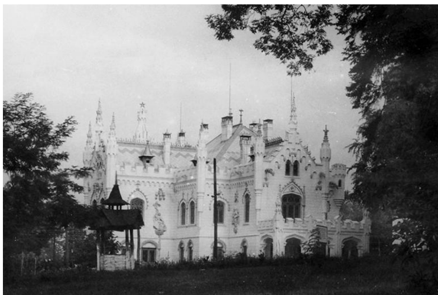
Fig. 2, Palatul Sturdza din Miclăușeni văzut din parc, 1963-1965

Spre deosebire de lista din 1955, în Lista bunurilor din patrimoniul cultural național al Republicii Socialiste România (monumente istorice) din 1980 parcul este definit ca monument și este înscris în una dintre cele patru poziții, respectiv 5839-5842, care formează ansamblul „Castelul Sturdza-Miclăușeni: conacul, biserica, clădirile anexe, parcul” 30 .