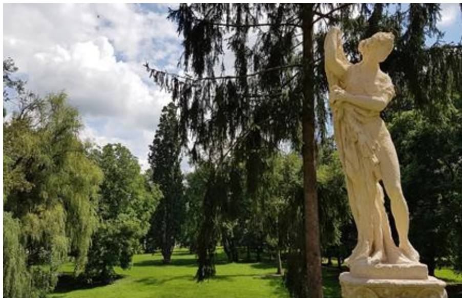
Fig. 3, Detaliu din parcul castelului Teleki din Gornești, 2019, Arhiva personală Alexandru Mexi.

două poziții care definesc ansamblul nobiliar, respectiv „6885-6886 m. arh. Castelul Teleki, cu parcul” 38 .