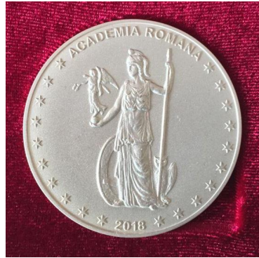
Fig. 1-2, Medalia „Omagiu celor doi savanți români *** Emil Racoviță - 1868 * 150 de ani de la naștere * 1867 - Grigore Antipa *** 2018”, Monetăria Statului.