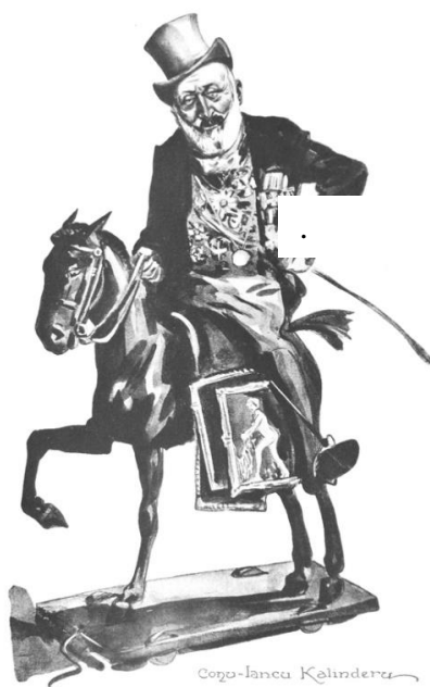
Figura 2. Caricatură de Nicolae Petrescu-Găină, reprezentându-l pe Ioan Kalinderu într-o postură stereotipică, călare, în costum de gală, dar purtând și câteva tablouri. Nicolae Petrescu-Găină, Albumul meu , 1913

Și tot Tudor Arghezi era cel care amintea, peste ani, de timpurile când respectatul „membru al Academiei Române, I. Kalinderu, complimenta sculptura pentru că era «în relief» și felicita pe pictori fiindcă peizagiul lor avea «mişcare»” 24 .